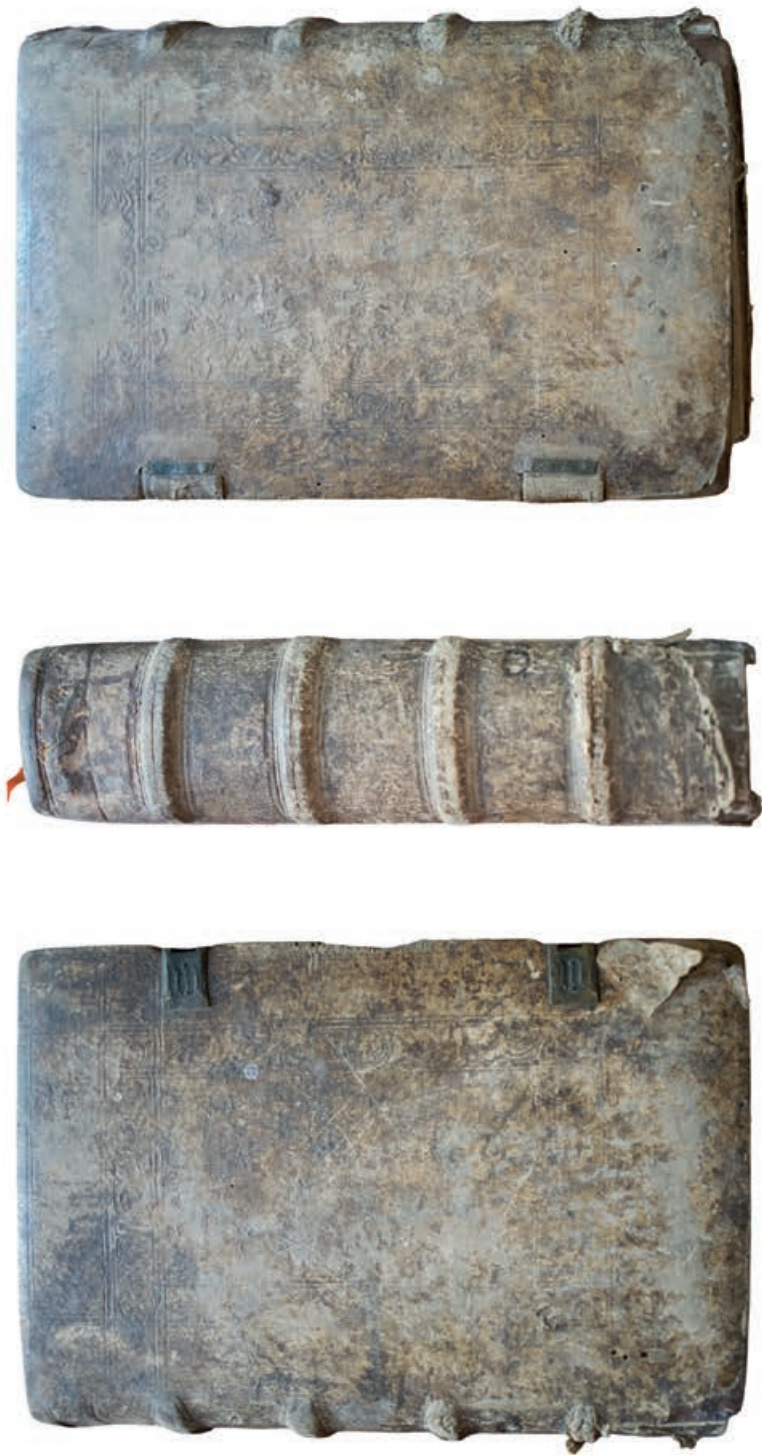
Fot. 8. Oprawa kodeksu